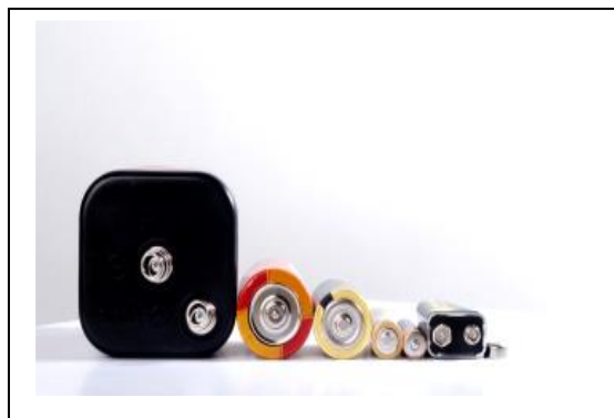
Différentes types de piles

Les piles et accumulateurs sont des sources d'énergie électrique obtenue par transformation d'une réaction chimique. Ils sont utilisés comme source d'énergie principale ou secondaire dans de nombreux appareils, aussi bien par les industries que par les ménages. Une pile est utilisable une fois, un accumulateur l'est plusieurs fois car il est rechargeable (processus réversible). Une batterie est un assemblage de piles ou d'accumulateurs. Chaque type de pile possède une composition unique de matériaux, qui détermine sa capacité, ses caractéristiques, son rendement et sa durée de vie. Une pile est composée comme l'indique les schémas ci-dessus d'un boîtier étanche (plastique ou métal) ; de deux électrodes : anode (-) et cathode (+) ; d'un électrolyte qui est un mélange chimique permettant aux particules chargées (ions) de circuler ; d'un collecteur qui transporte l'électricité vers les bornes ; de deux réactifs chimiques dont l'un peut libérer facilement des électrons (réducteur), et l'autre qui les absorbe (oxydant).