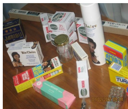
Produits cosmétiques contenant du mercure