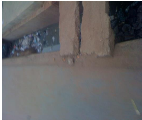
Déversement des eaux usées dans les caniveaux